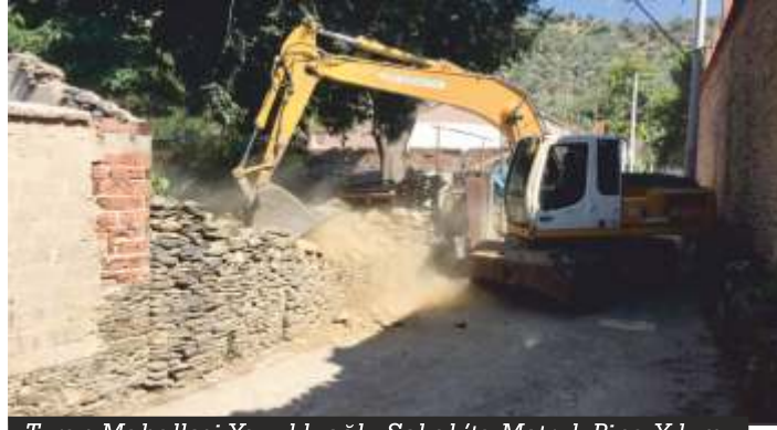
Turan Mahallesi Yavukluoğlu Sokak'ta Metruk Bina Yıkımı