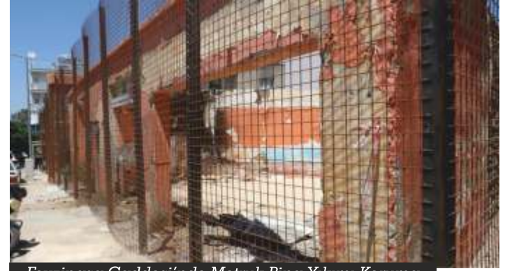
Fevzipaşa Caddesi'nde Metruk Bina Yıkımı Koruma