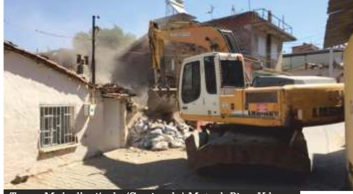
Turan Mahallesi'nde (Şanizade) Metruk Bina Yıkımı

Yıkılma tehlikesi bulunan binalar ise ekipler tarafından tedbir amacıyla demir korunaklarla çevrilerek güvenli hale getiriliyor.