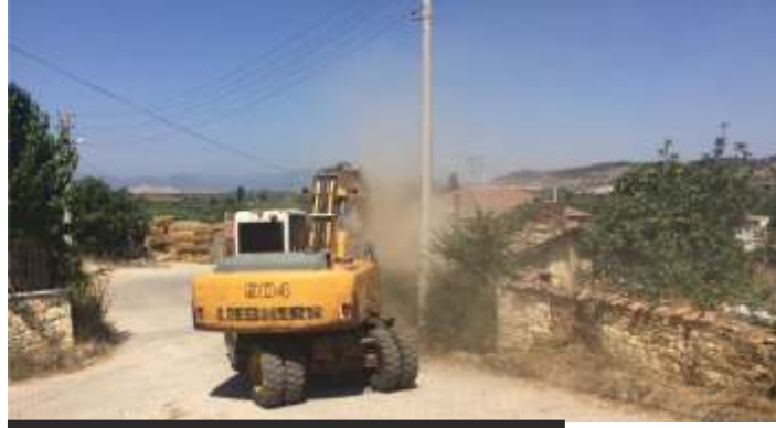
Yenioba Mahallesi'nde Metruk Bina Yıkımı