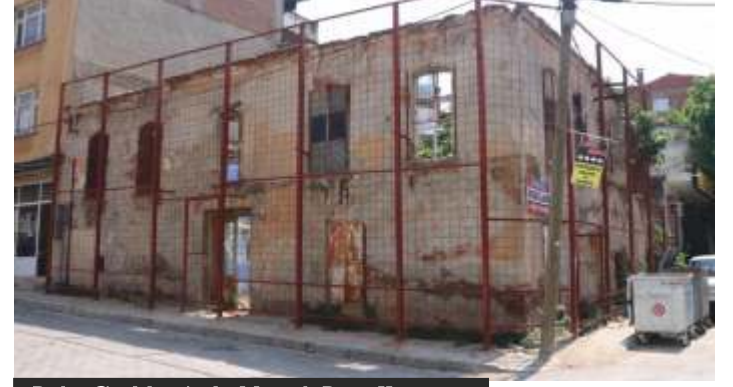
Balçı Caddesi'nde Metruk Bina Koruma