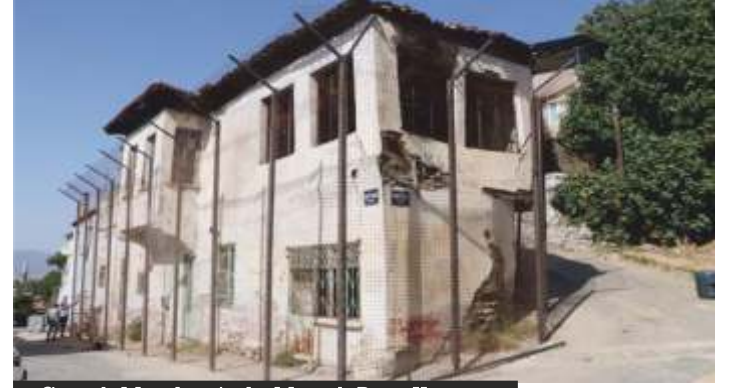
Suratlı Meydanı'nda Metruk Bina Koruma