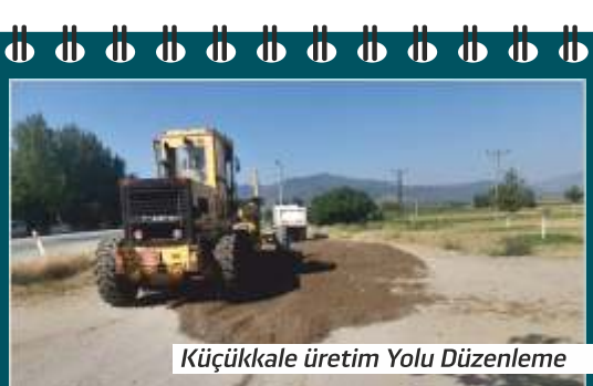
Küçük kale üretim Yolu Düzenleme