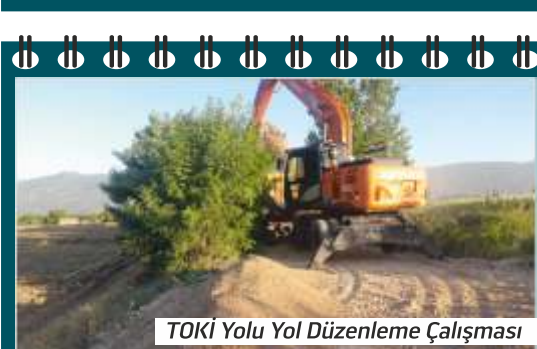
TOKİ Yolu Yol Düzenleme Çalışması