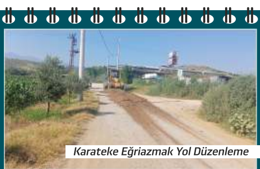
Karateke Eğriazmak Yol Düzenleme