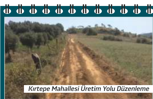
Kirtepe Mahallesi Üretim Yolu Düzenleme