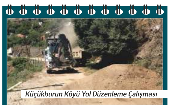
Küçükburun Köyü Yol Düzenleme Çalışması