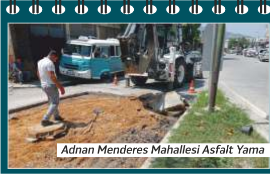
Adnan Menderes Mahallesi Asfalt Yama