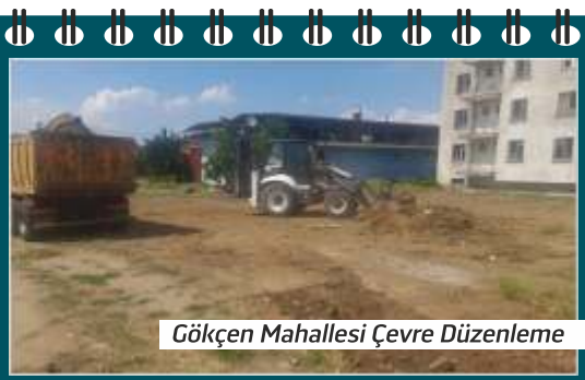
Gökçen Mahallesi Çevre Düzenleme