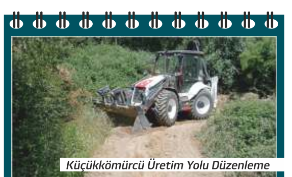
Küçükkömürcü Üretim Yolu Düzenleme