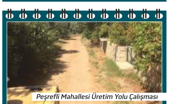
Peşrefli Mahallesi Üretim Yolu Çalışması