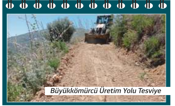
Büyükkömürcü Üretim Yolu Tesviye