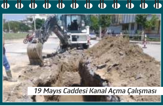
19 Mayıs Caddesi Kanal Açma Çalışması