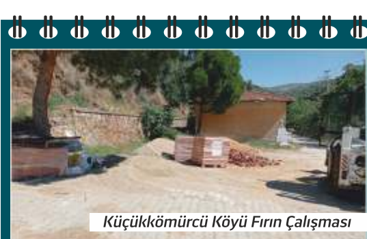
Küçükkömürcü Köyü Fırın Çalışması