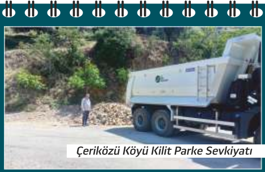
Çeriközü Köyü Kilit Parke Sevkiyatı