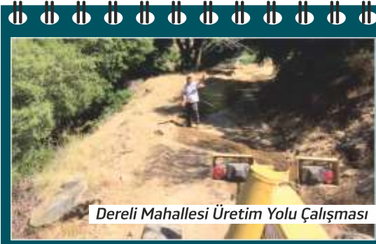
Dereli Mahallesi Üretim Yolu Çalışması