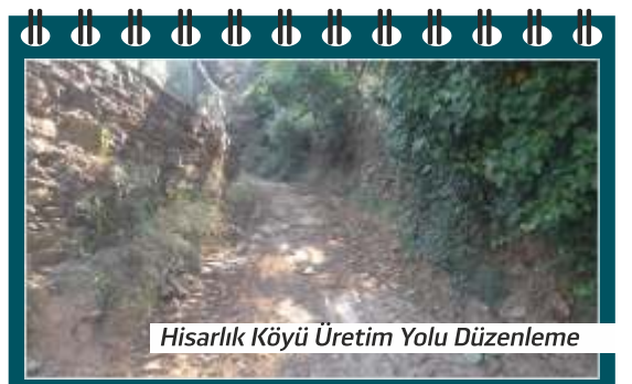
Hisarlık Köyü Üretim Yolu Düzenleme