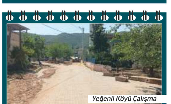
Yeğenli Köyü Çalışma