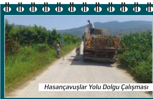
Hasaıçavuşlar Yolu Dolgu Çalışması