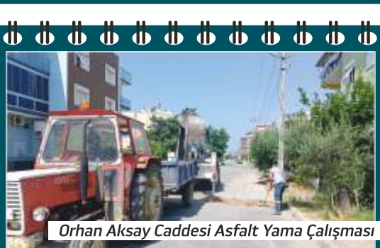
Orhan Aksay Caddesi Asfalt Yama Çalışması