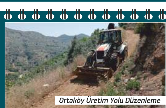
Ortaköy Üretim Yolu Düzenleme