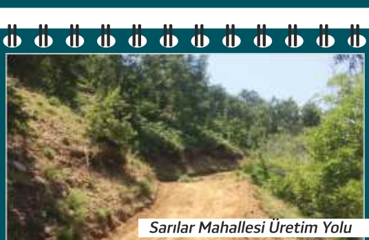
Sarılar Mahallesi Üretim Yolu