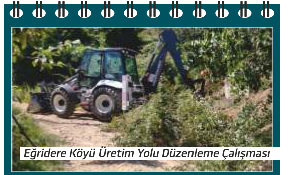
Eğridere Köyü Üretim Yolu Düzenleme Çalışması