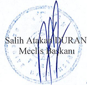
Salih Atakan DURAN Meclis Başkanı

Yukarıda metni yazılı rapor Başkanlıkça okutturularak görüşülmüş olup; Söz konusu raporun Plan ve Bütçe Komisyonundan geldiği şekilde kabulüne, Meclisimizce oybirliği ile karar verildi.